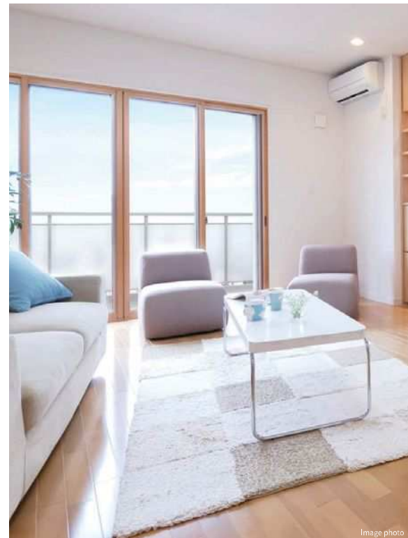
マドリモ 内窓 プラマードU